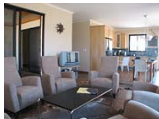
Küche und Wohnen