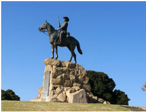
Das Reiterstandbild ...