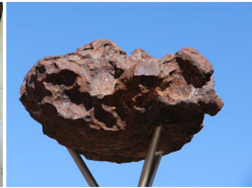
einer der Gibeon Meteorite

Wollen Sie bei den Herstellern von Kunstgewerbe direkt einkaufen, so gehen Sie ins Namibia Craft Center in die Talstraße (stehen Sie mit dem Rücken zum Kalahari Sands gehen Sie nach rechts die Independence Ave hinunter. An der nächsten Ampelkreuzung - Sam Nujoma Drive - nach rechts und dann links in die Talstraße). Haben Sie ein wenig "Sinn" für Farben und Formen, können Sie sich hier "schwindelig" kaufen (zusätzliche Reisekoffer finden Sie in den Ledergeschäften: -))) ).