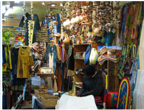
im Namibia Craft Center ...