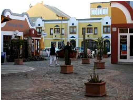
egal, ob in der gemütlichen Altstadt ...