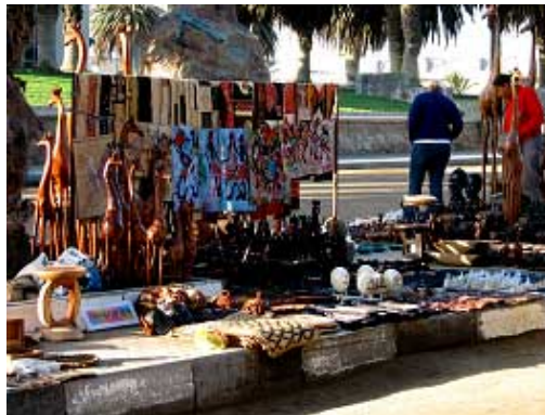
bei einem der Straßenhändler ...