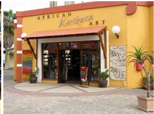
oder in einem der vielen Geschäfte