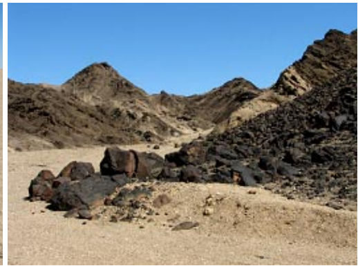
in der Mondlandschaft, kurz vor der Oase Goanikontes