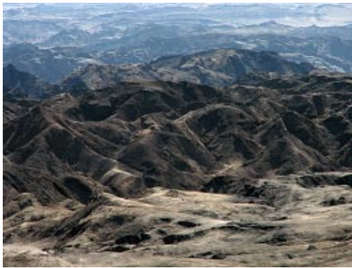
Die Mondlandschaft des Namib Naukluftparks, gesehen von einem der Aussichtspunkte