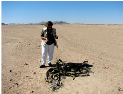
Welwitschiapflanze, nicht schön aber selten und bis zu 2000 Jahre alt