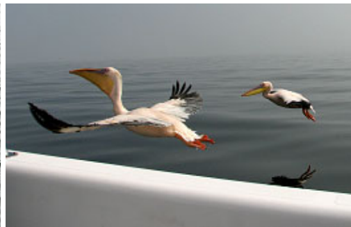
... Pelikane und