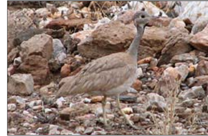
... die Gackeltrappe - ein Meister der Tarnung