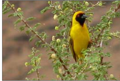
... ein Webervogel und ...