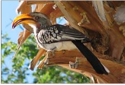
... Toko ...