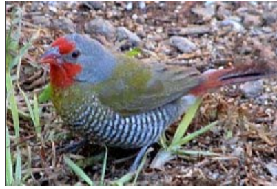
... ein Zebrafink und ...