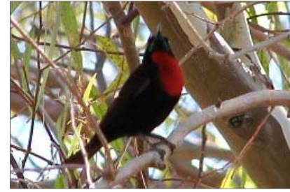
... ein Rotauge