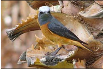
... ein Kurzzehe Rötling ...